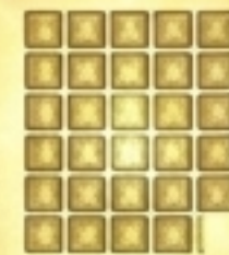
Muslimin ( \pm 313 )

“ Kami tidak akan menjadi seperti Bani Israil. Kami akan sentiasa bersama Rasulullah ke mana pun baginda pergi.